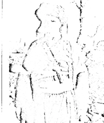
A Kurdish bodyguard, 1946

ers who live in small villages noted for their competitive clan structure and unruliness. They have at times even earned a reputation for brutality. The Turks provoked some Kurdish tribes to join in the massacre of Armenians near the end of the 19th century. Perhaps the most famous Kurd in history was Saladin, the legendary military leader who battled Richard the Lionheart and proved the wildest and most effective defender of Islam against the invading Crusaders.