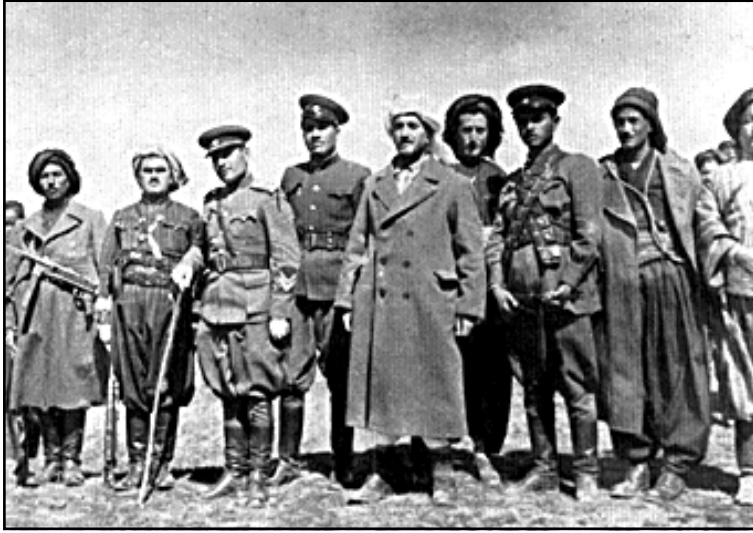
القاضي محمد رئيساً للجمهورية