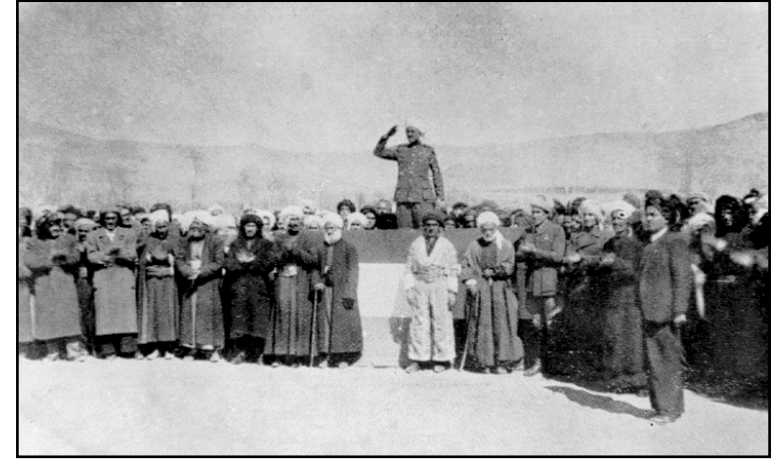
القاضي محمد في يوم إعلان الجمهورية. البارزاني واقف في المقدمة ٢٢ كانون الثاني ١٩٤٦