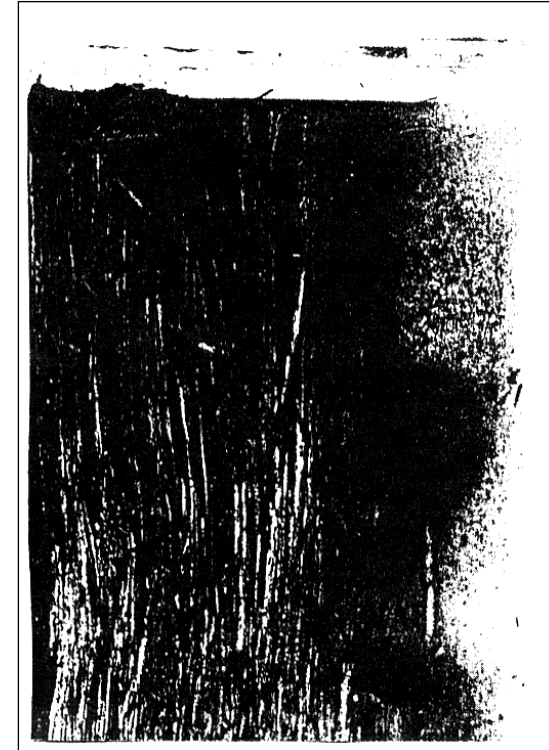
30 پاشماوهی تهخته کۆنه کانی چیا ی تارارات

ئه لیکسانده ر پۆلیه ستۆر ALEX. POLYHISTOR به و شیوه یه ی که له ئۆزابیۆسی ئه رمه نی باسی کردوه ده لیت «که شتییه که و پاله وانه بابلییه که ی (کسیسوتروس) XISUTHROS له رۆژی لافاوه که دا له سه ر