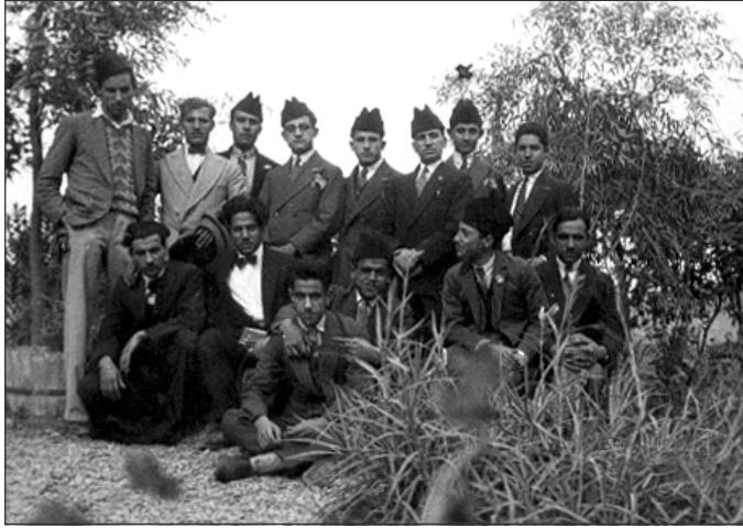
وینهی گهشتی «فهللوجه»

رۆژهکەى سهيران؛ دلّ حەزى له گەشت، لەش ئارەزووى بزووتنى هەبوو. هەر ئهوهندهم زانى مامۆستا که مان تهنهنگه کهى کرده شانى به گه له يهک قوتابيهوه رووى کرده دهشته که، راوى ئه و مه له به سه زمانه بکا! مینیش ئارەزووم له وان که متر نه بوو بۆ راو، باوجود رۆلهى ولايتیک نه بووم هه ميه شه راوى تيانه بێ؛ به هه له داوان خۆم گه ياندنێ، نزیکيان نه بوومه وه به ته واوه تى، ته قه يه که هه لسا، مه لتيکی رهنگاوره نگ (پۆرتیک) له حه واوه سه ر نه نگرێ بوو، که وته سه ر زه وى و هه رام کرد، سه رم برى و گرم به ده ستمه وه؛ مامۆستا که رووى تى کردم: - ئه وا ئه م مه له له به ر تۆ ده کوژم.