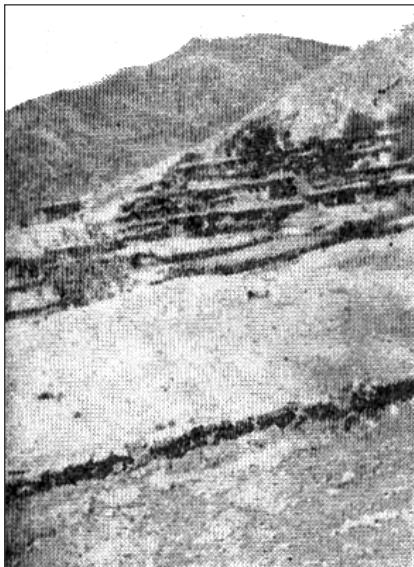
چاوه‌ندازنیک به‌رزنجه به‌سی به‌شی ماله‌کانی و ره‌زه‌کانی به‌رامبه‌ریه‌وه.