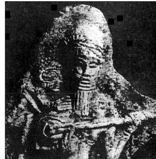
په‌یکه‌ری گلینی ته‌نبورژه‌نیک که‌ له: شووش - دۆزراوه‌توه ١٥٠٠ ساڵ پیش زایین