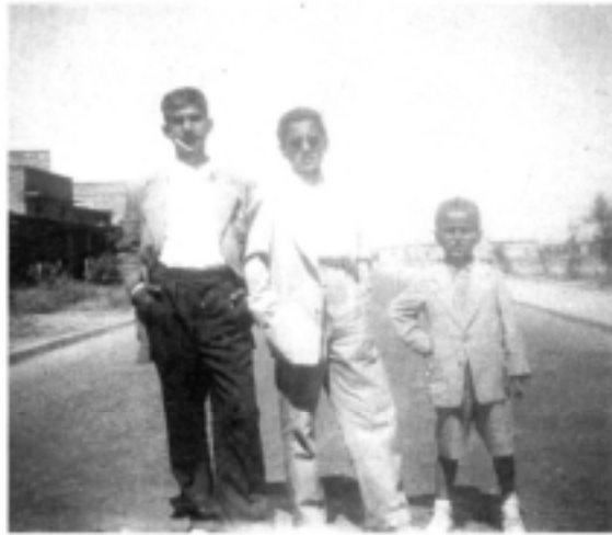
يوم عيد الاضحى عام ١٩٥٢م