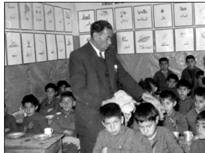
به رتيوه بهري قوتابخانه ي كاتيسكان له گه ل قوتابيهه كاندا