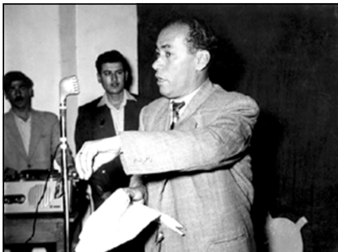
له هه‌موو بۆنه‌یه‌کدا هه‌ستی خۆی دهر‌په‌وه