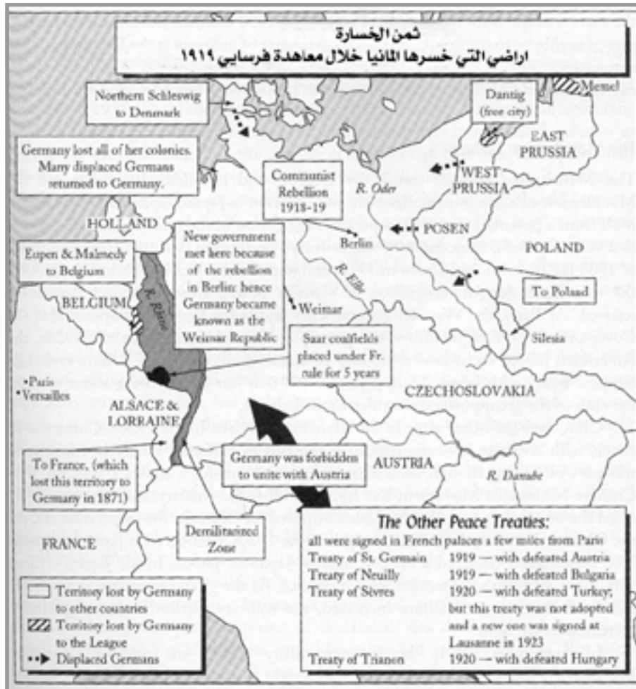
ملحق رقم (٧) الاراضي التي خسرها المانيا بعد معاهدة فرساي ١٩١٩