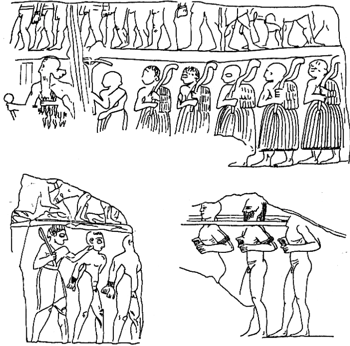
عدد من السوياريين الذين ساقهم سرجون إلى مدينته أكد في الألف الثالث قبل الميلاد - متحف لوفر