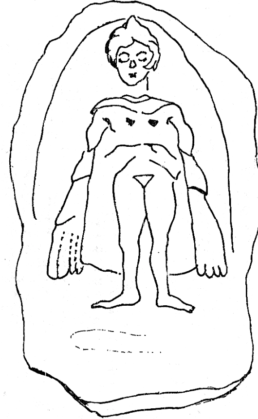
لوحة تصور الالهة شاوشكا الحورية من متكشفات نوزي- الألف الثاني ق. م.