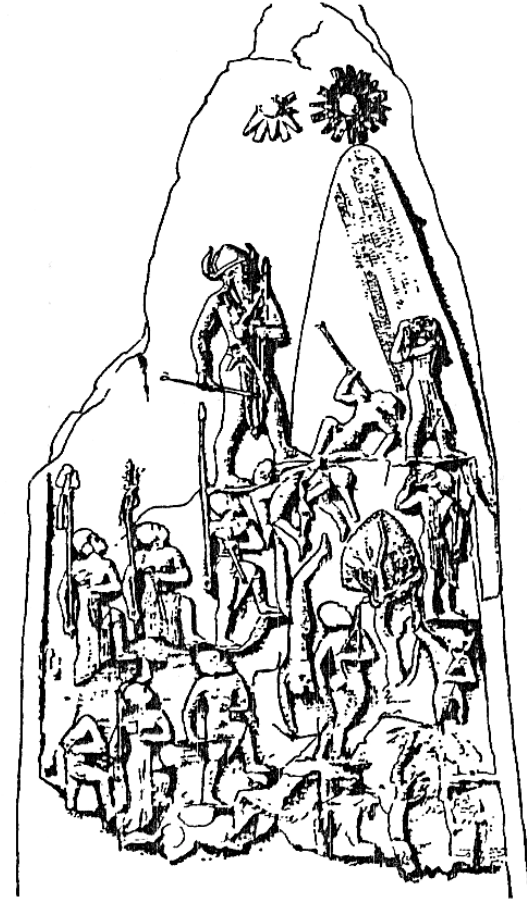
مسلة نارام سن ٢٢٥٠ - ٢٢٠٠ ق.م. متحف لوفر