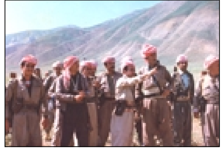
إدريس بارزاني وسط مجموعة من الپیشمرگه