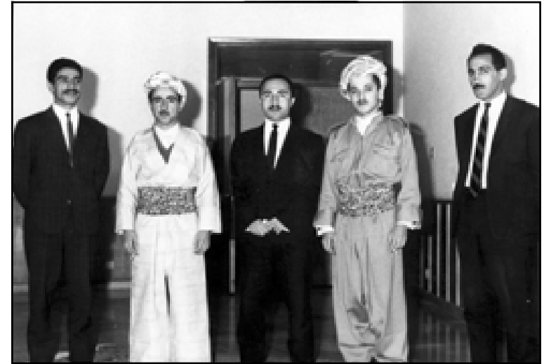
في وسط الصورة: مسعود بارزاني، محمود عثمان وإدريس بارزاني بعد اتفاقية آذار ١٩٧٠ بغداد