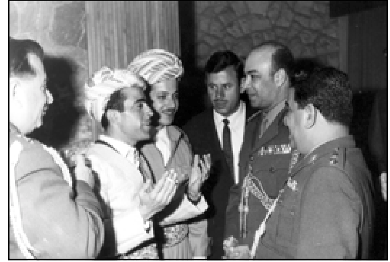
إدريس بارزاني ومسعود بارزاني مع الملحق المصري وضباط عراقيين - بغداد ١٩٧٠