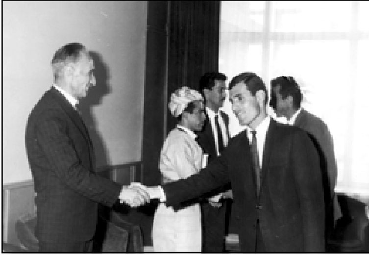
من اليمين: سامي عبدالرحمن، إدريس بارزاني وصالح اليوسفي خلال استقبالهم المهنيين بمناسبة اتفاقية ١١ آذار ١٩٧٠ في مقر الفرع الخامس للحزب الديمقراطي الكردستاني ببغداد