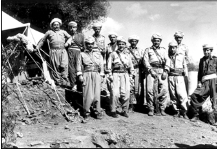
إدریس بارزاني محاطاً بعدد من الپيشمرگه