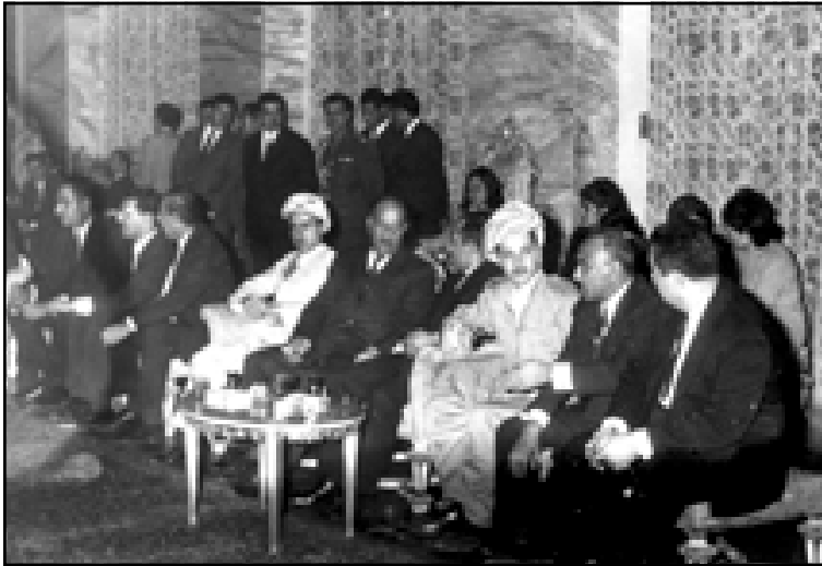
من اليمين: حردان التكريتي، صالح مهدي عماش، مسعود بارزاني، ..... الرئيس العراقي أحمد حسن البكر وإدريس بارزاني. بغداد ١٩٧٠