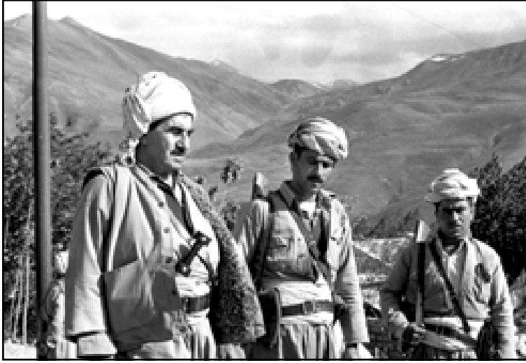
مصطفى بارزاني مع اثنين من الپيشمرگه