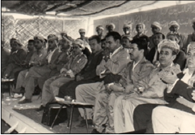
إدريس بارزاني وفي اليمين أحد الضيوف، حبيب محمد كريم، سامي عبدالرحمن، نوري شاويس وعلي عبدالله في المؤتمر الثامن للحزب الديمقراطي الكردستاني ناوپردان ١٩٧٠