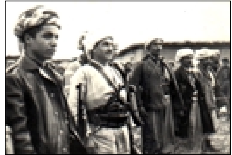
مصطفى بارزاني مع نجله مسعود بارزاني رانیه - ١٩٦٤