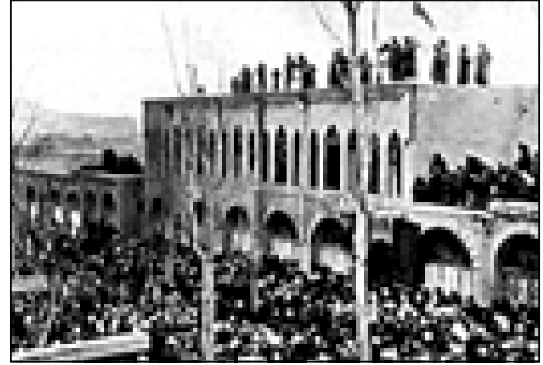
انزال العلم الإيراني ورفع علم جمهورية كردستان في مهاباد