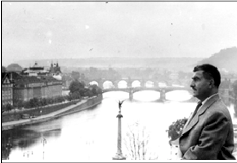
مصطفى بارزاني في الإتحاد السوفيتي السابق