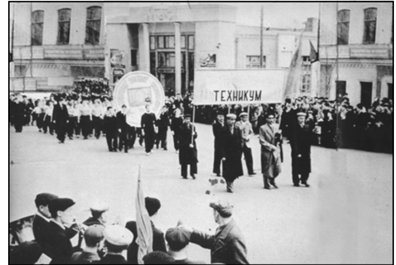
تظاهر البارزانيين احتجاجاً على سياسات ستالين بحقهم