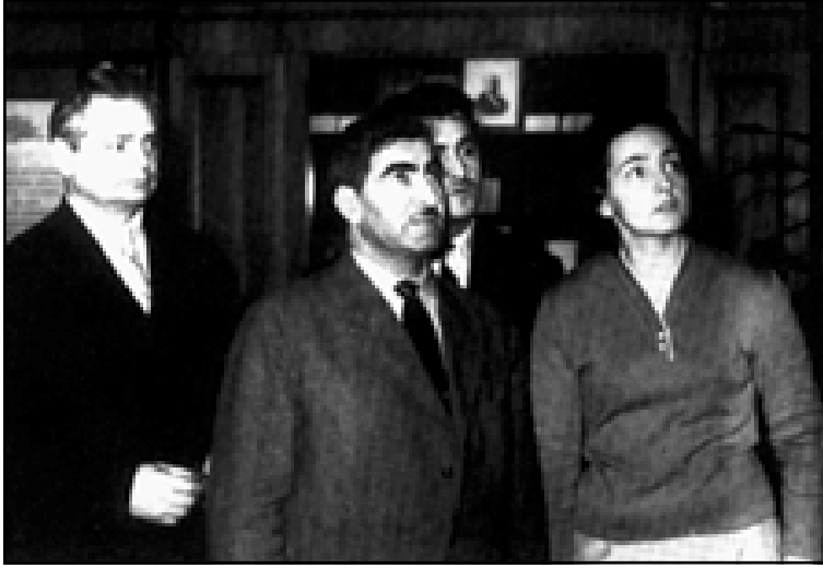
مصطفى بارزاني في زيارة لأحدى مؤسسات الدولة السوفيتية - ١٩٦٠