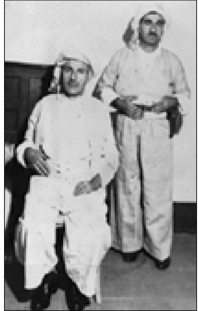
الشيخ احمد بارزاني (جالساً) وخلفه يقف مصطفى بارزاني - ١٩٥٩