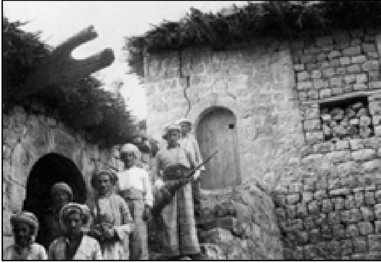
احدى دور شيوخ بارزان بعد تعرضها للقصف العراقي ١٩٥٥