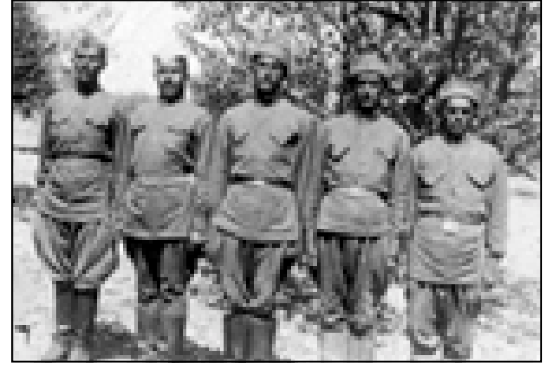
مجموعة من الپیشمرگه البارزانيين أثناء تدريبهم العسكري في الإتحاد السوفيتي السابق