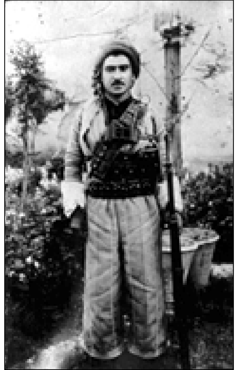
مصطفى بارزاني - ١٩٤٣