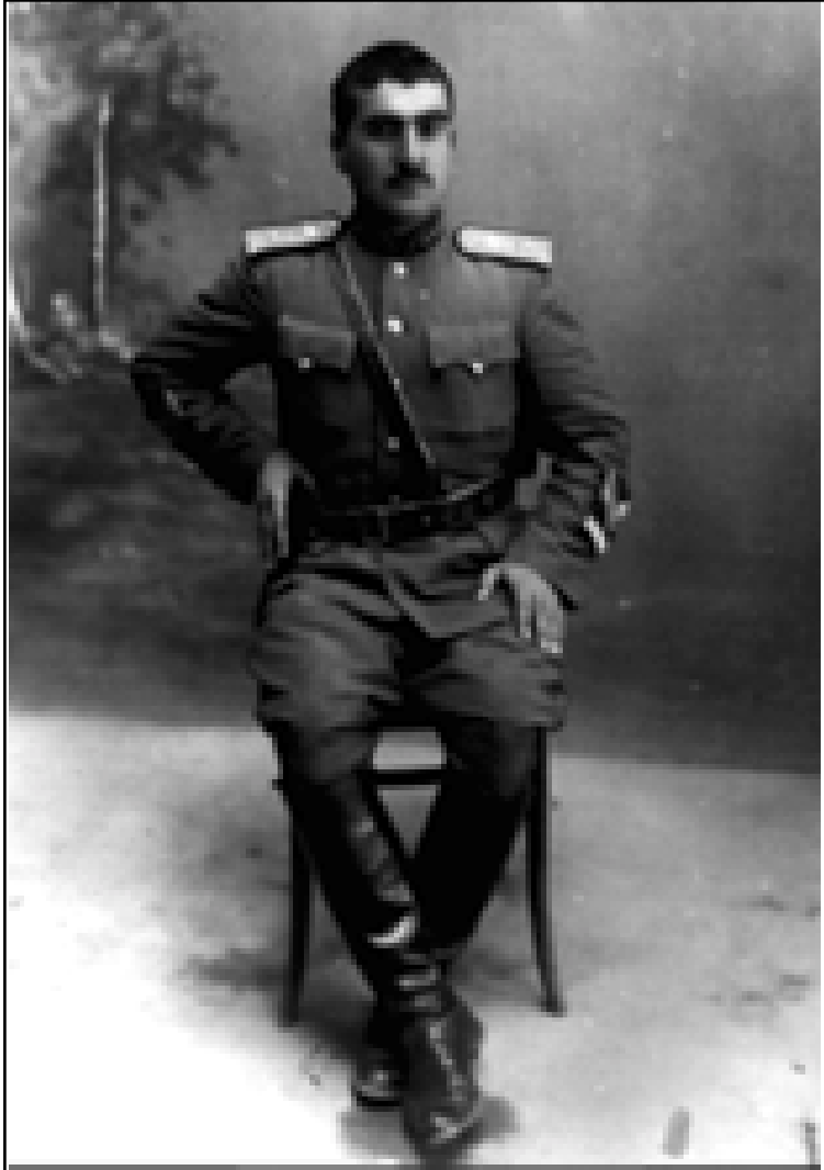
الجنرال مصطفی بارزانی له مهاباد