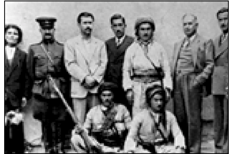
مصطفی بارزانی في مهاباد ۱۹۴۶ وعلى اليمين: قدری جمیل پاشا وخیرالله عبدالکریم

وعلى اليسار: عزت عبدالعزيز، نوري احمد طه وميرحاج احمد