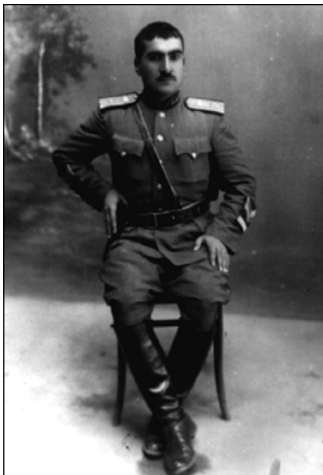
بارزانی له مههاباد، به جلویهرگی جهنه رالییه وه